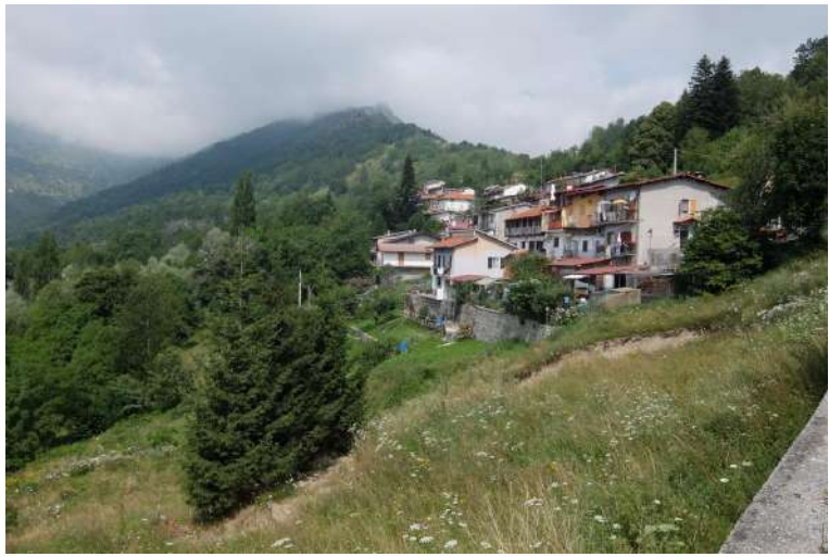
...sfiorando la frazione di Tetti Soprani, fino...