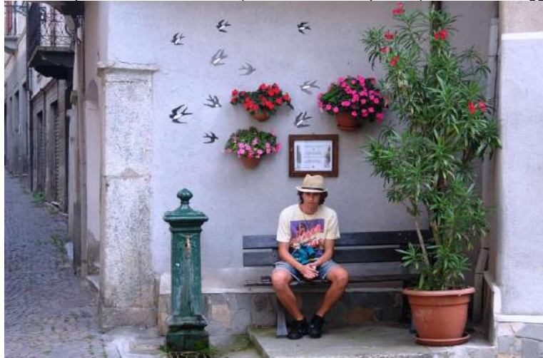
Angolo di Garessio