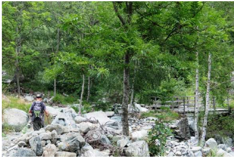
si perde quota tra la vegetazione fino al torrente Armella (altro ponte).