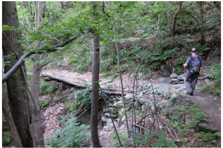
Si supera un tratto ripristinato dopo l'alluvione dell'autunno 2016