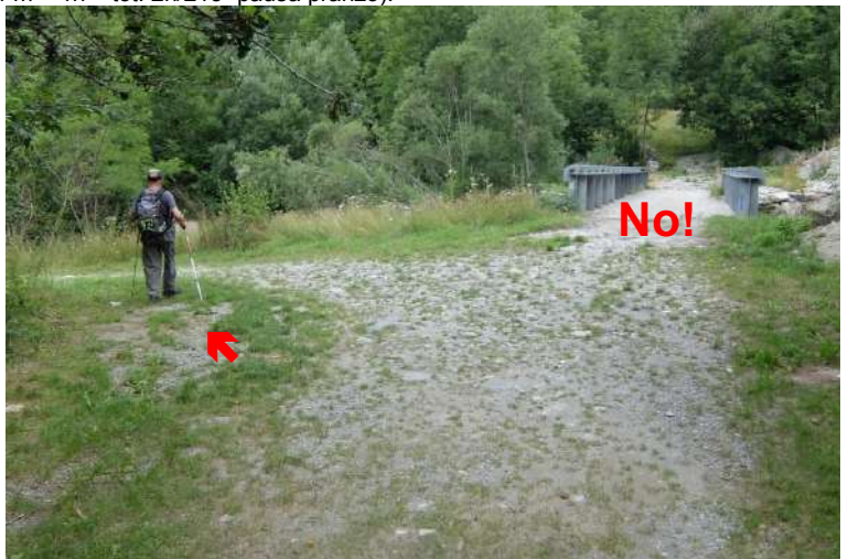
Quando si riparte, si ricalca l'asfalto in discesa per un centinaio di metri e poi si piega a destra a gomito (simboli). Si raggiunge il torrente, ma non si attraversa un ponte di notevole dimensioni, a quanto pare inutile...