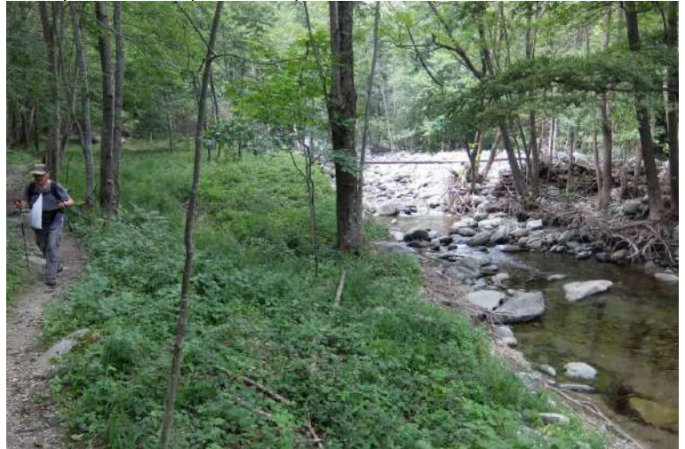
...costeggiare il rio in un tratto in cui ci sono diversi tronchi abbattuti