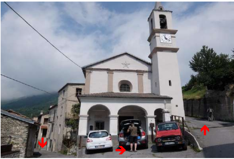
Dall'edificio sacro si svolta a sinistra su asfalto...