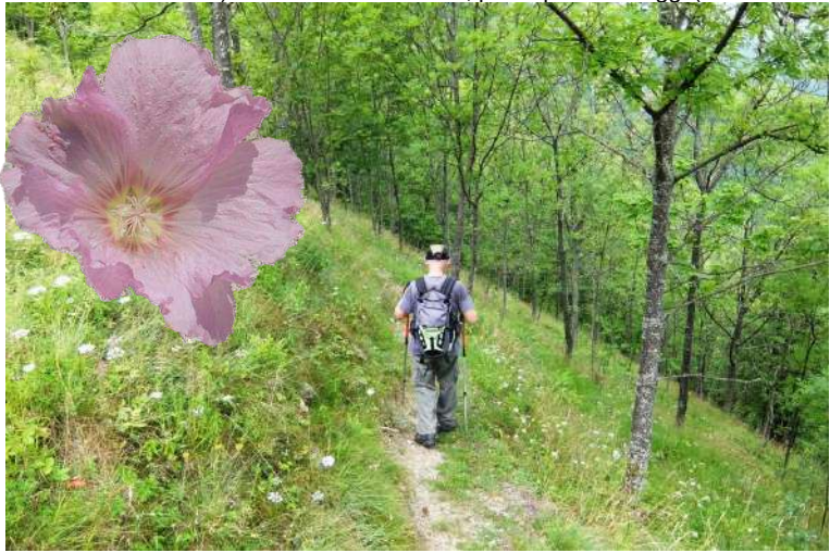
Qui si piega in discesa, prima a destra e, pochi metri dopo, ↙ a sinistra, sempre a gomito.