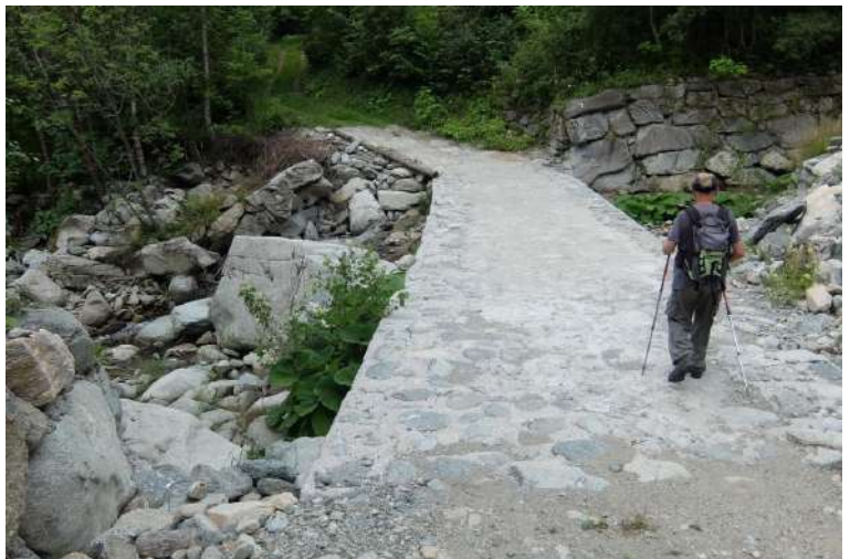
il passaggio avviene più avanti e prestando attenzione alle bandierine bianco rosse su alberi e pietre si continua a perdere quota...

Gite in Val Tanaro e zone limitrofe negli anni http://www.cralgalliera.altavista.org/GiteValTanaro.htm