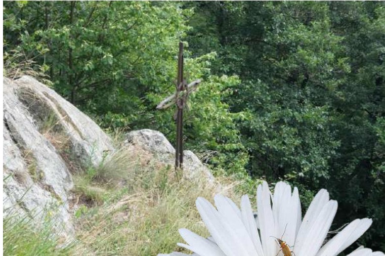
Infine, si arriva a...