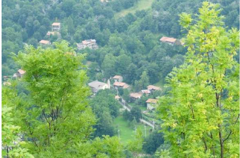
(Panorama su Valdarmella ↗) - ...al Colle di Chionea, punto più alto x oggi (1219 m – 20')