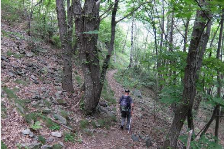
La via è appena accennata