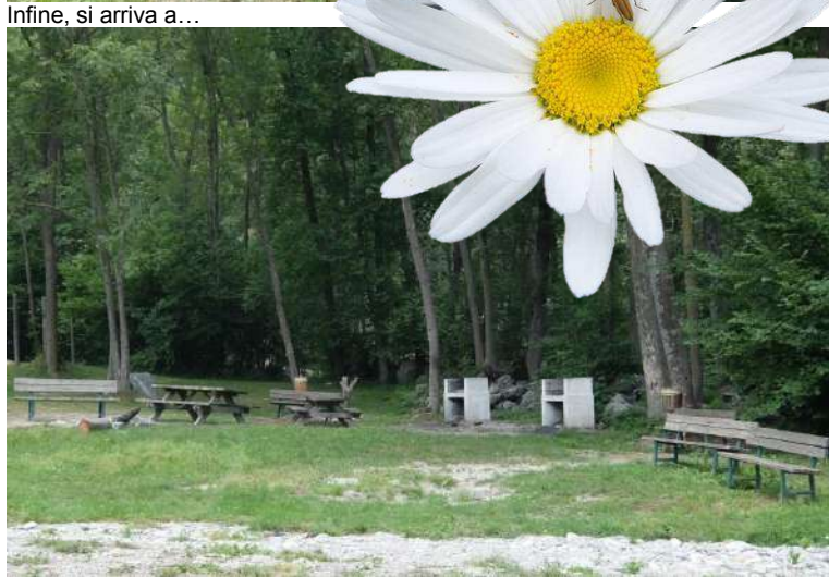
Si sfiora il parco fluviale Altramella (con alcuni tavoli e panche) e in breve si raggiunge il centro di Ormea (736 m – 1h15)