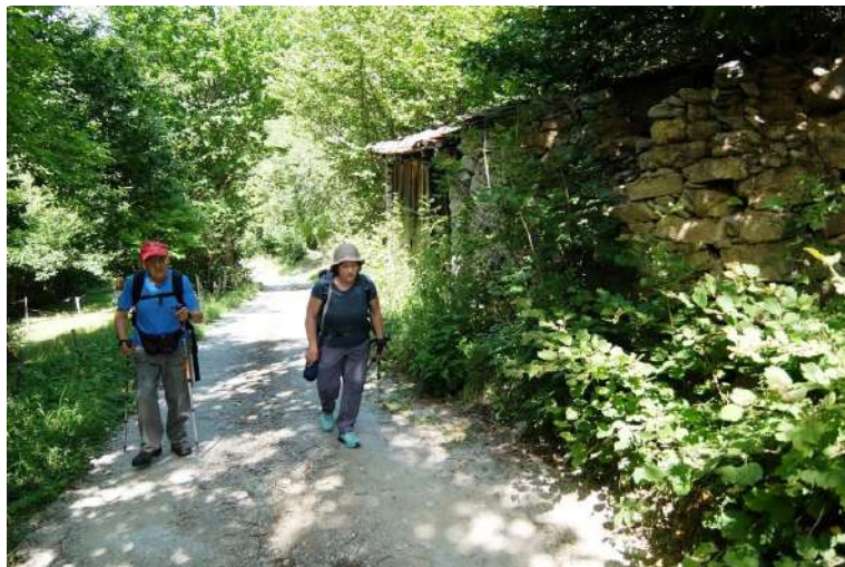
La pista cementata si inerpica nella vegetazione che regala così un po' d'ombra.