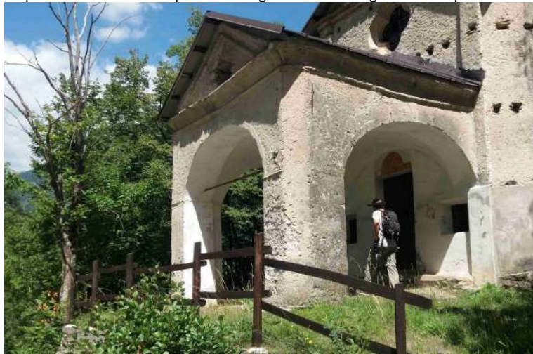
LP - La strada spiana in corrispondenza del piccolo edificio sacro dedicato alla Madonna (860 m - 50'), dove è possibile fare una sosta.