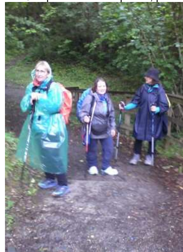
...vista la pioviggine...