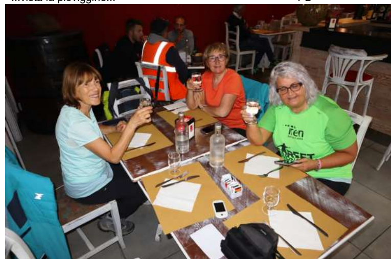
Bar Baraonda a pranzo