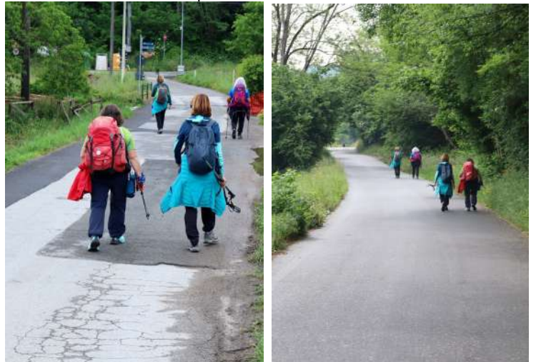
Notizie: http://www.cralgalliera.altervista.org/72.pdf Nelle pagine del documento Un'idea sono presenti diversi link d'approfondimento sull'argomento in parola