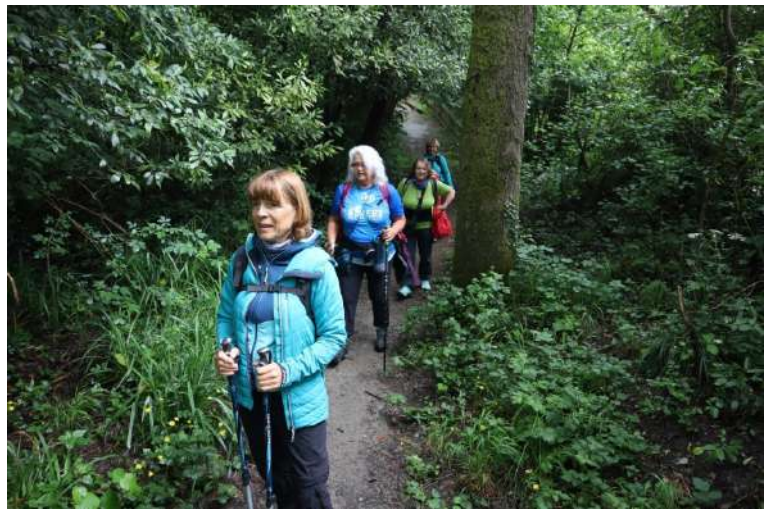
percorso del secondo giorno... * Il ns Santiago, con diverse notizie: http://www.cralgalliera.altervista.org/SantiagoBuenCamino022.htm