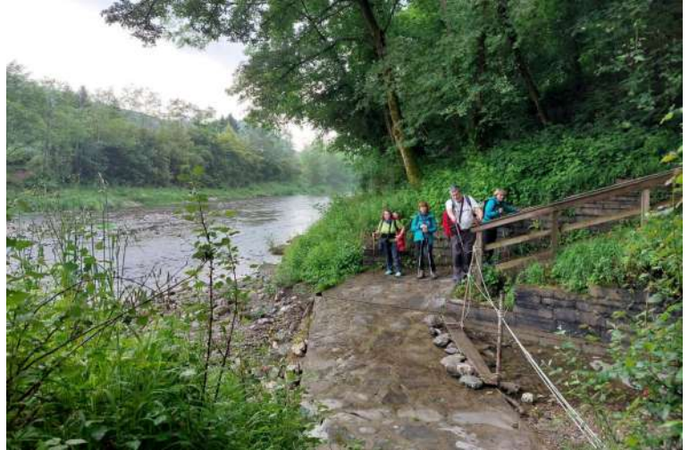
I numeri 2023 di Un'idea: http://www.cralgalliera.altervista.org/UnIdea2023.htm