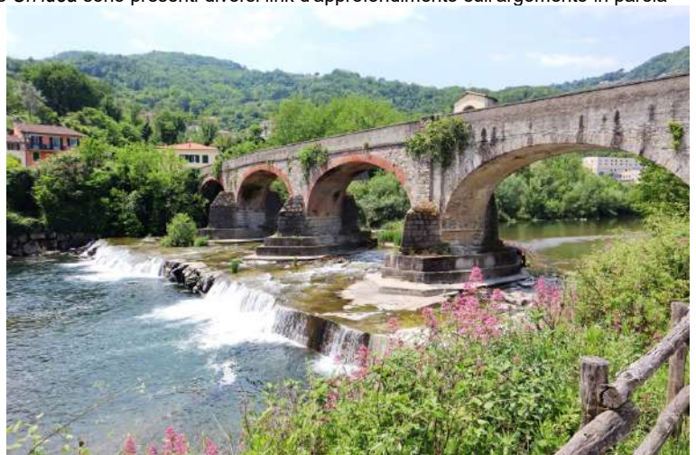
Pontevecchio a Carasco