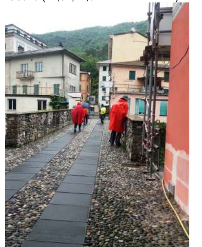
Superando il ponte a Cicagna per la sosta PL