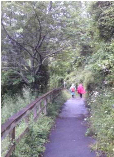
alcune foto fatte con il vecchio telefonino GT-C3510 (20,30,40,60 scatto da inizio )