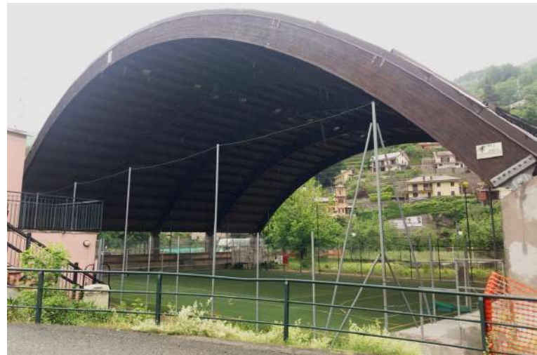
PL Campetto di calcio riparato, poco dopo la partenza da Gattorna