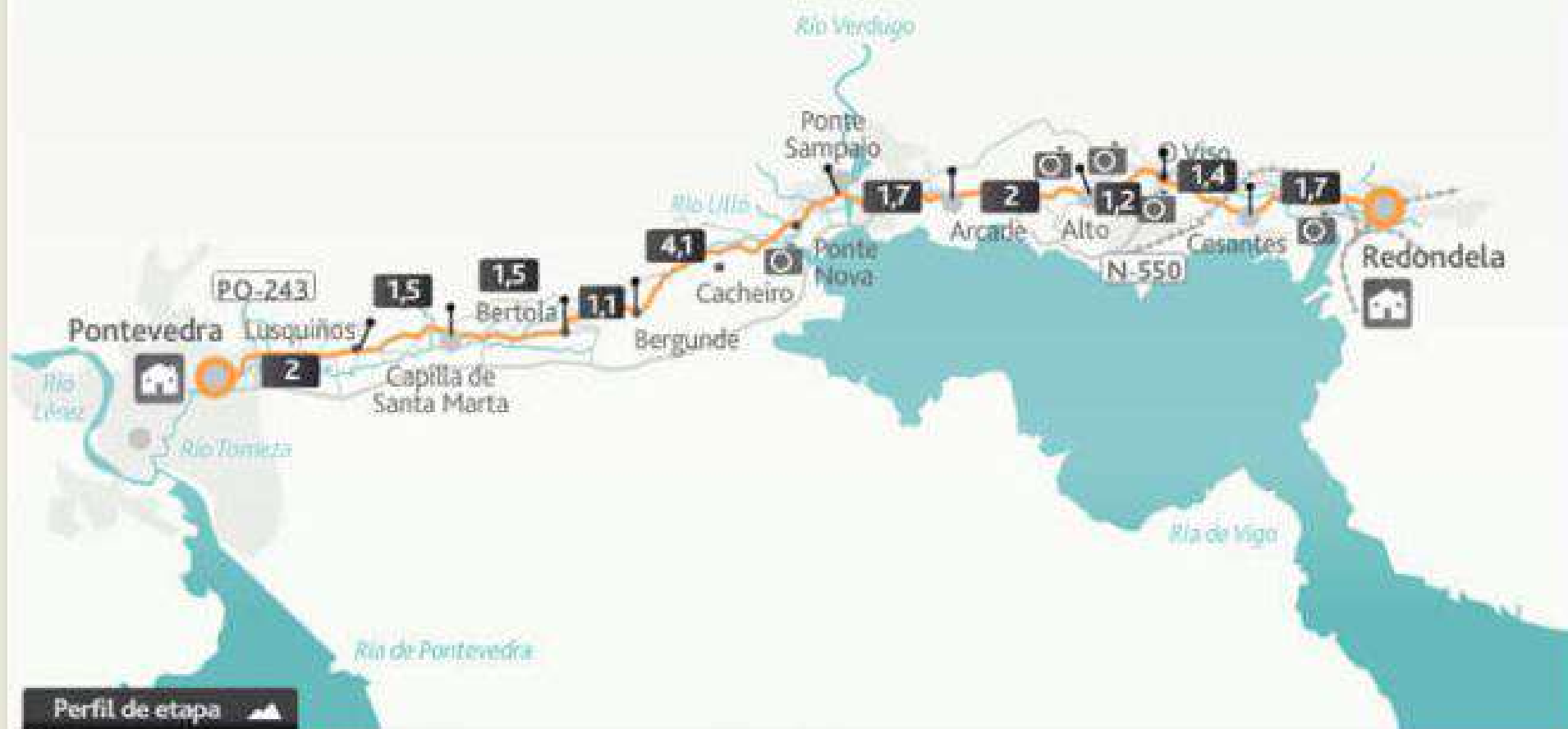
Perfil de etapa