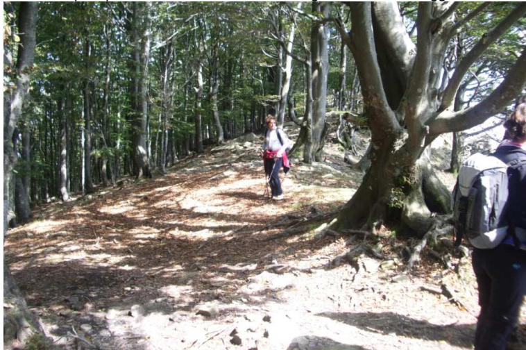
La cima principale del Monte Ramaceto è a 1345 m, però quasi passa inosservata, mentre la Cappelletta si trova ad una quota più bassa, 1318 m, ma è in una splendida posizione molto panoramica; dislivello: circa 550 m durata: circa 4/5 ore di cammino in totale

Altre info al link http://www.cralgalliera.altervista.org/esc.htm Foto altre gite http://www.cralgalliera.altervista.org/anno2015.htm