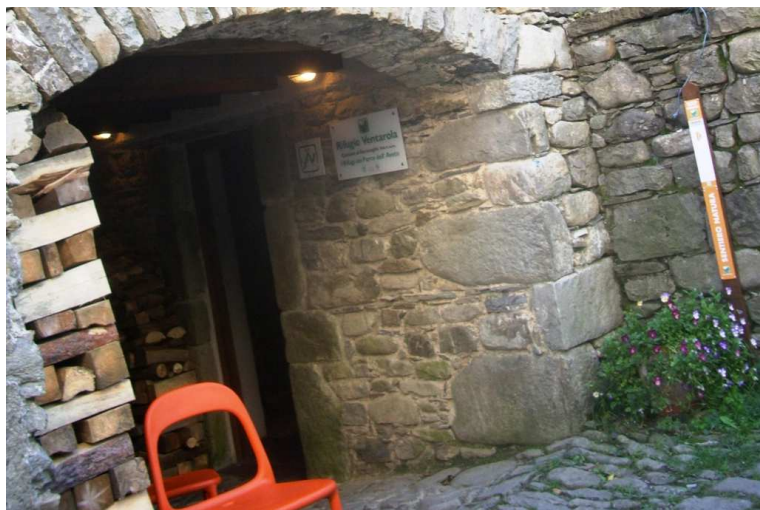
La gita si svolge lungo anello del Monte Ramaceto, partendo da Ventarola (850 m).