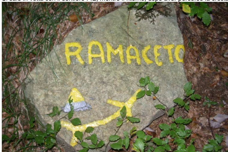
Dopo un primo tratto pianeggiante si attraversa una bella faggeta. Prima della vetta ci si inerpica per una ventina di minuti e bisogna avere una maggiore attenzione.