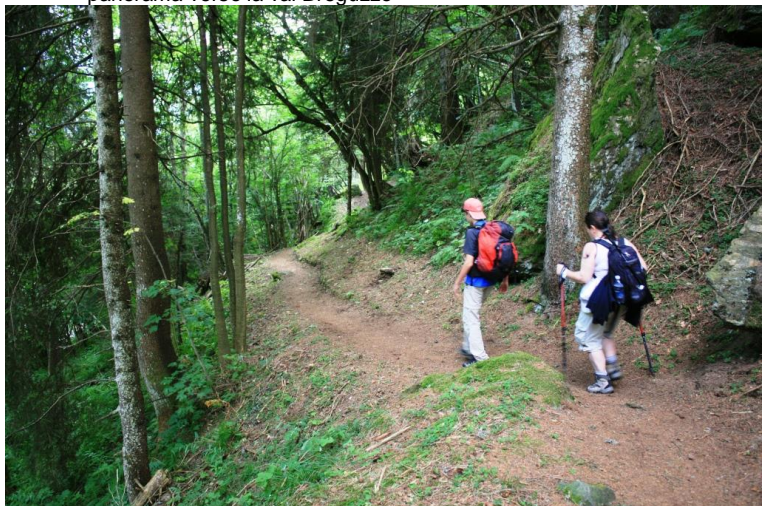
Volendo al ritorno si può fare una digressione nel bosco fino all'auto (1h)