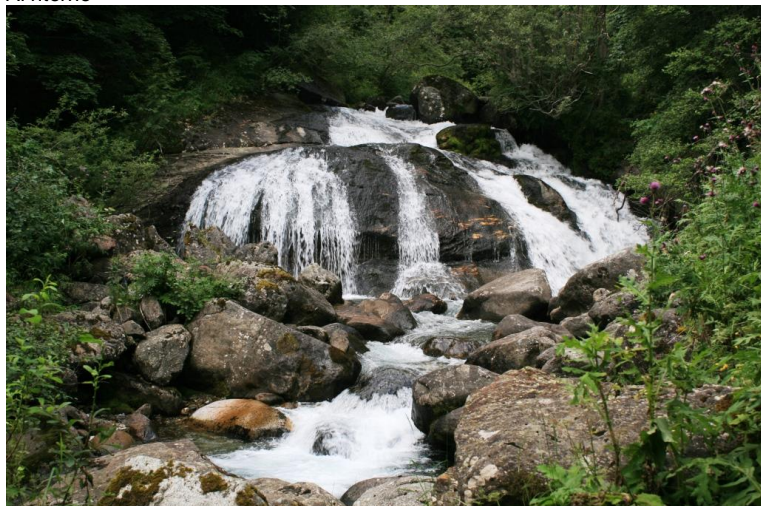
Escursione facile in un bel ambiente con molta acqua. . . (2h15 Tot - 430 m disl.)