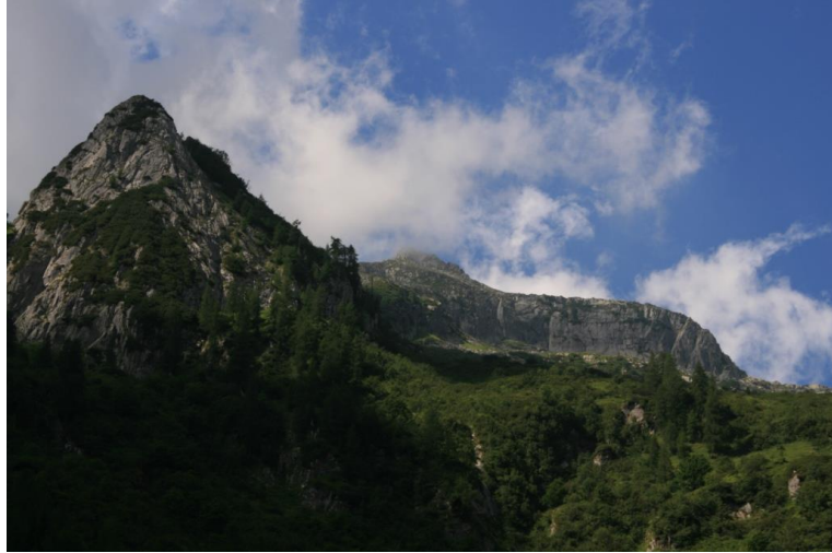
Vista verso l'alta valle