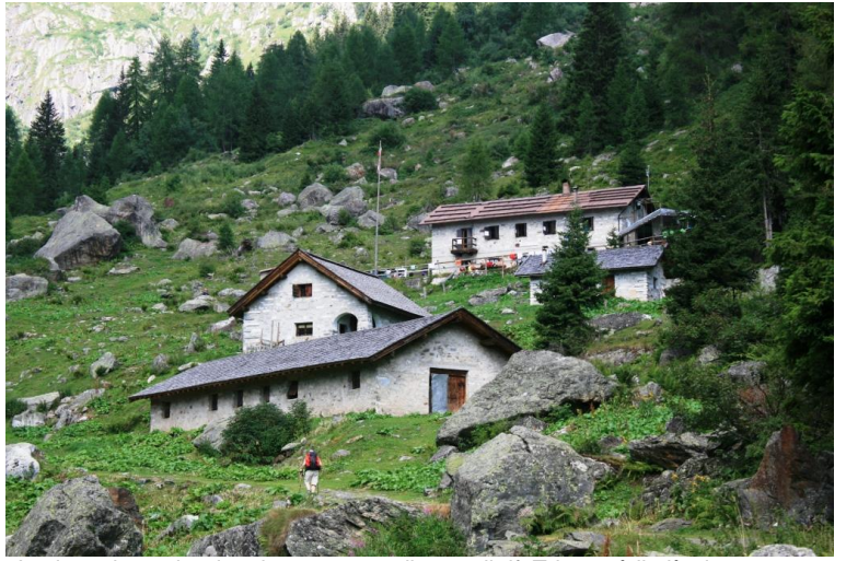
In circa 1h 15 si arriva da un gruppo di case, il rif. Trivena è il più alto a 1650 mt