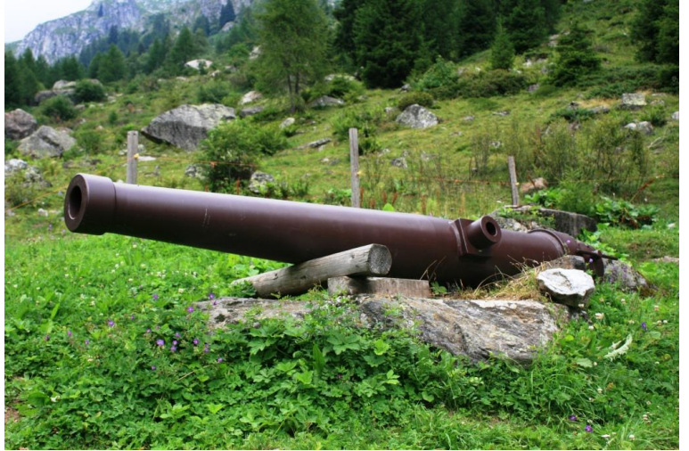
affusto di cannone dal rifugio