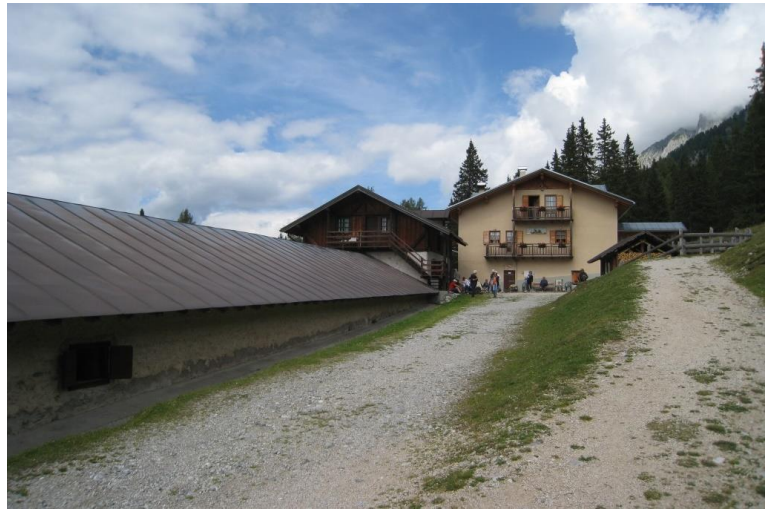
Con i mezzi pubblici si sale da Folgarida al Passo Campo Carlo Magno 1682 mt. da dove si scende fino a Malga Mondifrà 1629 mt in 40'