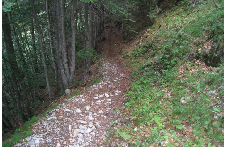
Si continua a scendere per la val Meledrio, ignorando via via i vari cartelli che invitano a rientrare subito a Folgarida e rimanendo sulla destra ideografica del torrente