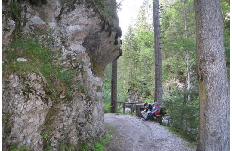
Si segue la pista principale fin quasi al ponte Pastin, ma lo stesso non viene raggiunto per continuare dritti verso il ponte Pison. Siamo sulla vecchia strada di collegamento che univa il fondovalle a Madonna di Campiglio durante il regno di Francesco Giuseppe che la percorse più volte fino al 1902