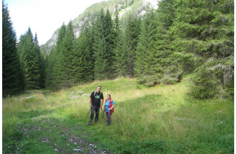
Cisi immette in un nuovo sterrato nei pressi di malga Centoma, dove si piega a sn e si passa il torrente su un bel ponte 1h