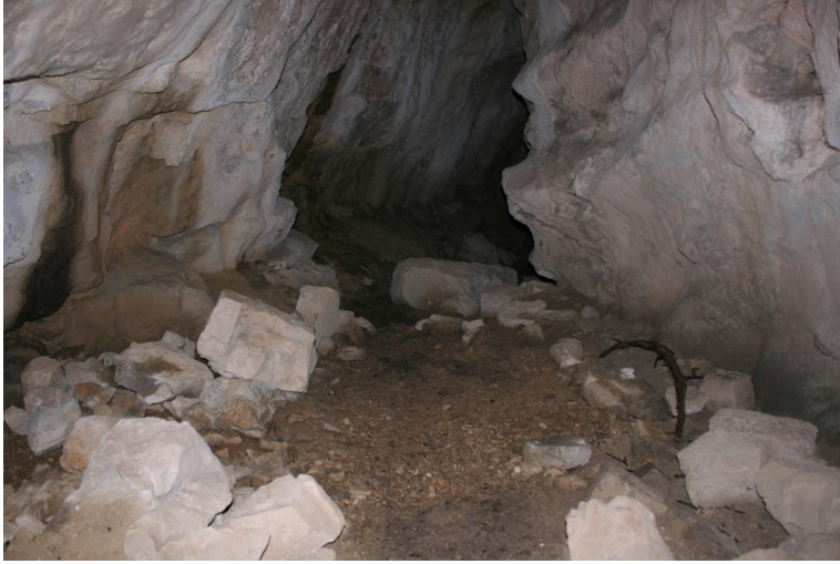
L'interno della grotta, 15' x A/R

La Grotta Cesare Battisti si apre con vari ingressi sulla parete (un dedalo di cunicoli e sale dedicati solo agli esperti del settore. . .)