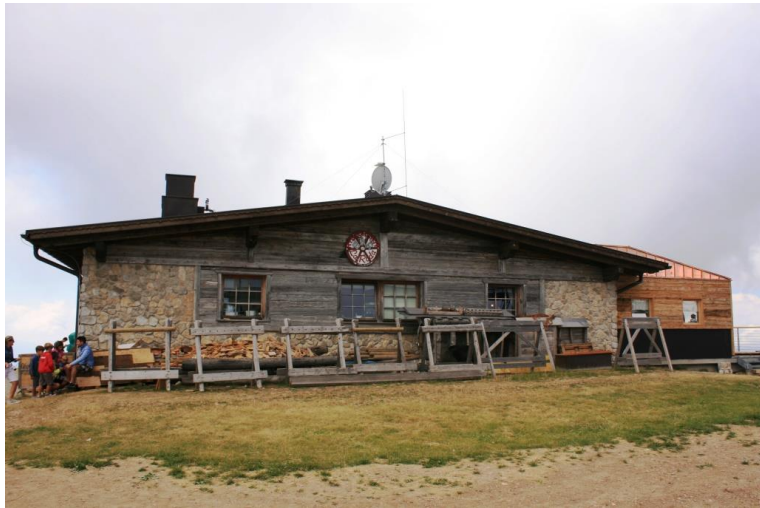
Il rifugio Roda presso la cima della Paganella 2125 mt, raggiunto con gli impianti da Andalo