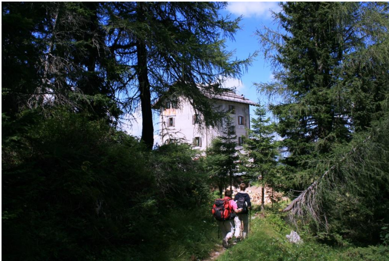
Verso il Rif. Dosso Larici, 1900 mt. Circa in 40'