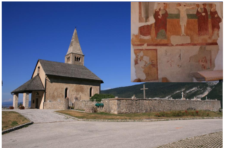
la chiesa di San Tommaso del XIII secolo lungo il ritorno in auto