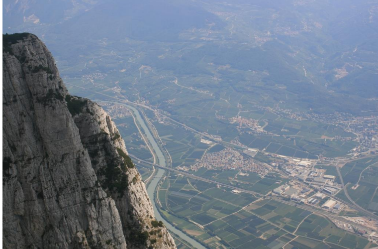
la valle dell'Adige