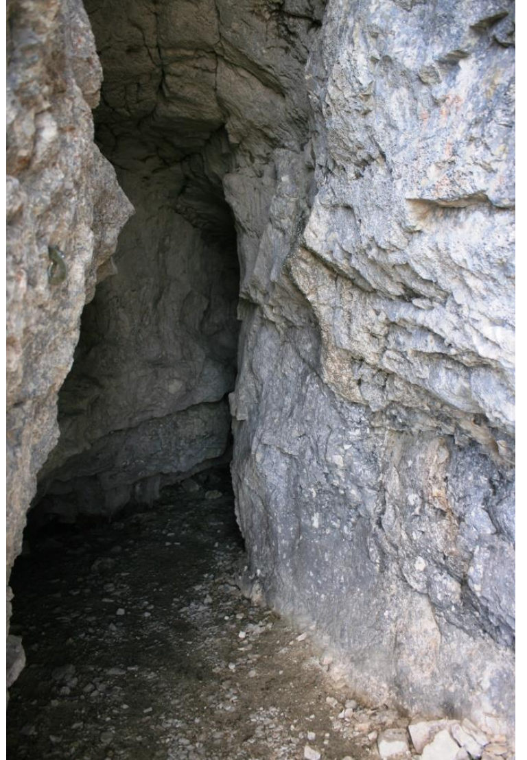
La grotta Cesare Battisti →