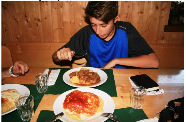
Polenta con spezzatino e con formaggio fuso... !!!