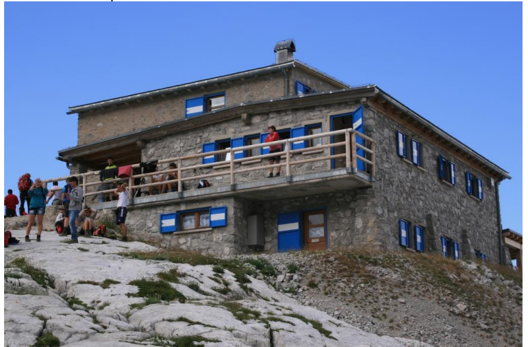
... il rifugio XII Apostoli a 2489 mt