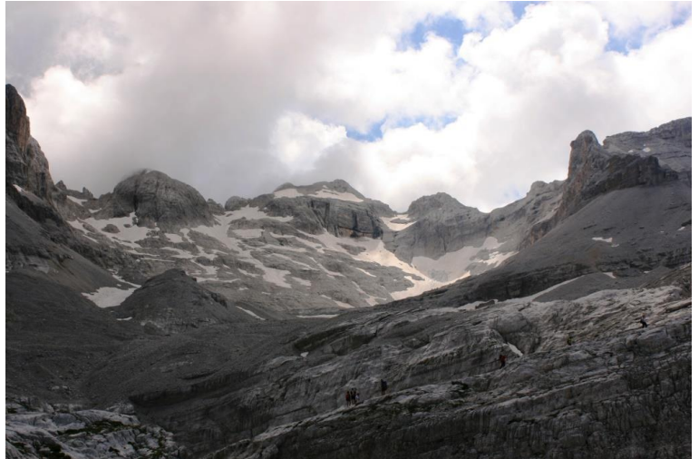
Molta neve in quota