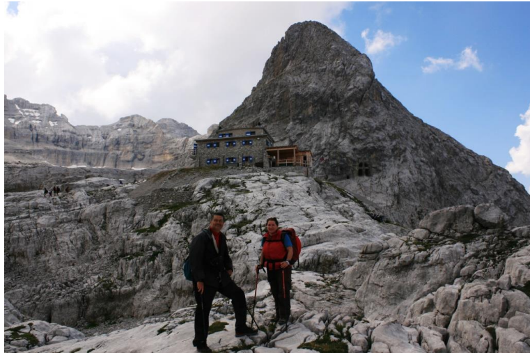
Ancora 75' per...