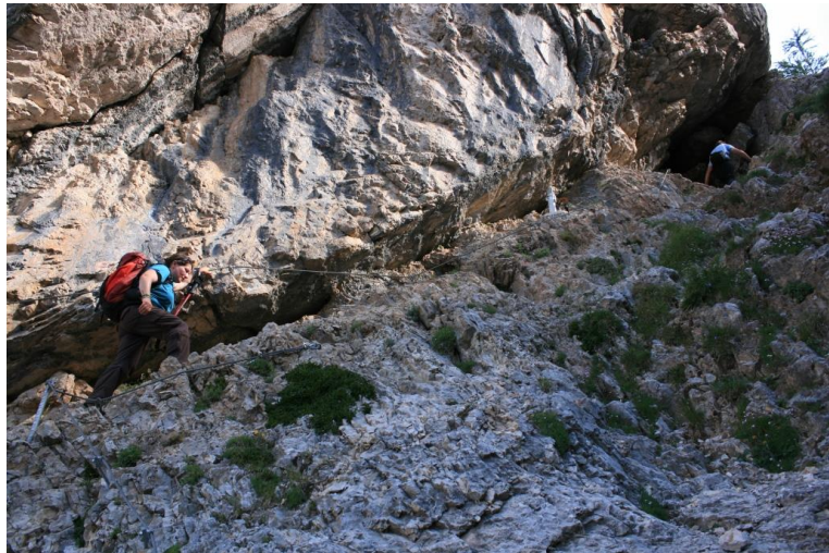
una madonnina lungo la via...