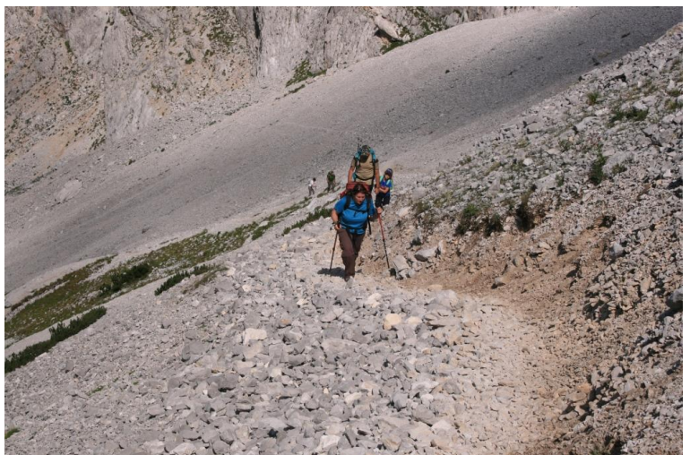
Ora si alternano tratti facili ad altri più impegnativi, con cui si superano diverse rocce levigate...