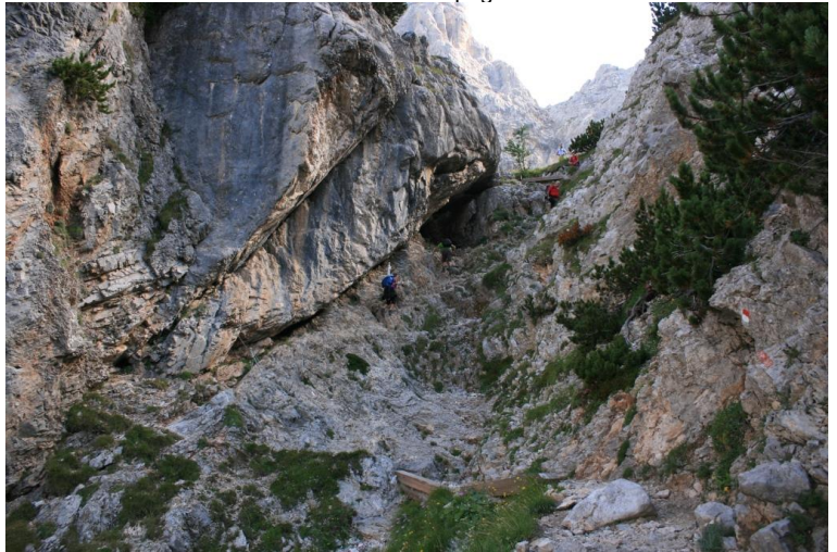
... fino alla famosa "Scala Santa"...