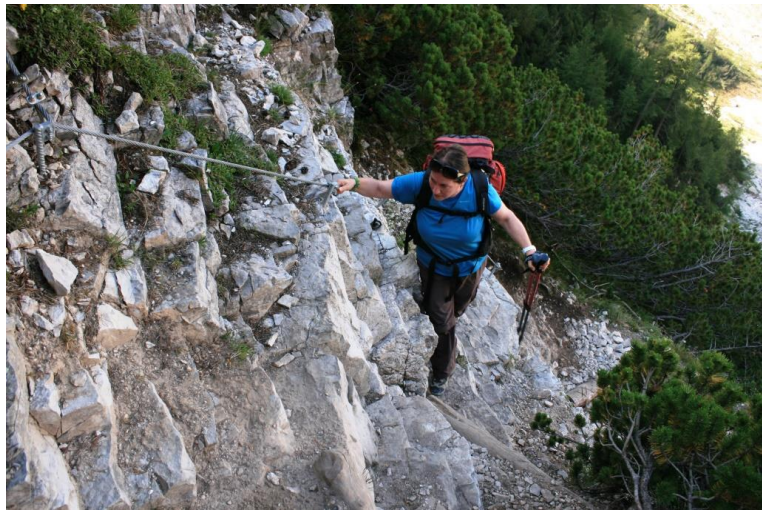
O meglio, da qui.....!!!!!!!!!!!!!!!!!!!!