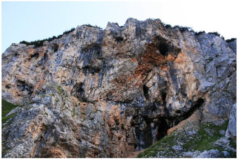
si alternano tratti normali ad altri impegnativi...