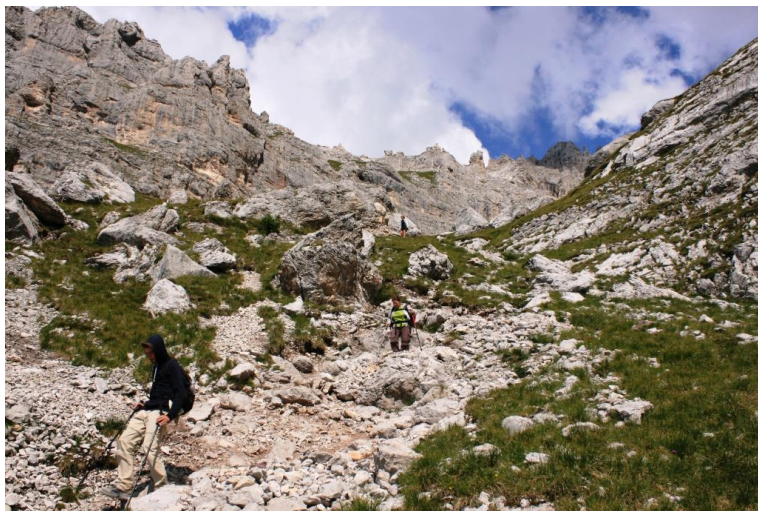
Decisamente non si fanno mancare i tratti ripidi e moderatamente complicati...!!!!!!!