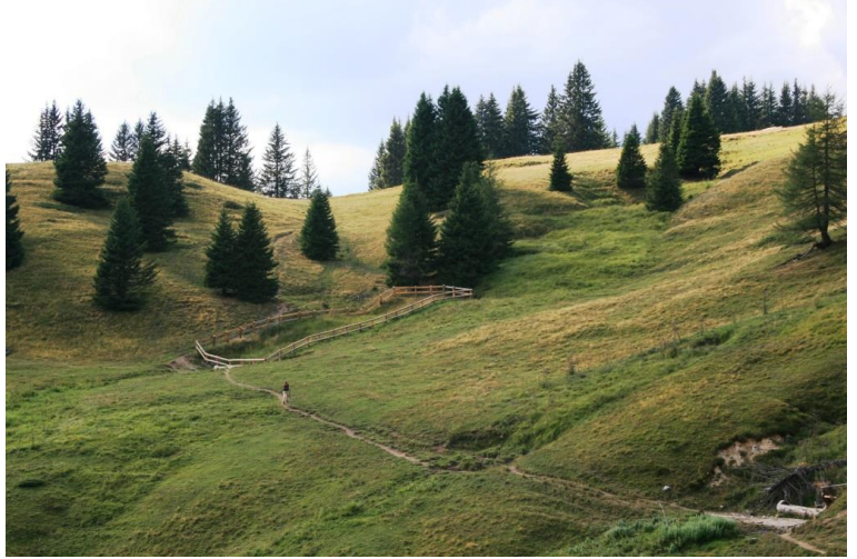
Sono solo modesti saliscendi, ma non si è certo riposati...