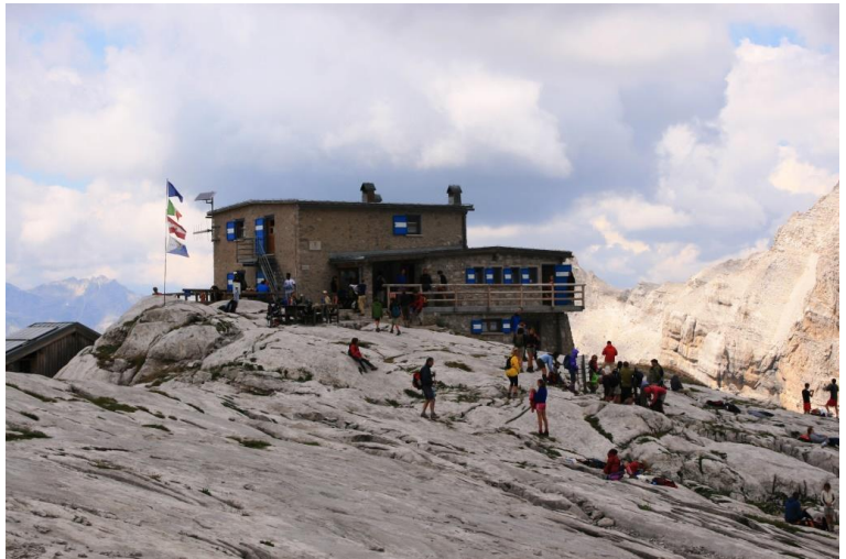
Vista verso il fondovalle dal rifugio --- la discesa, se bagnata, diventa ancora più difficile e visto il pericolo di pioggia ( ma non si verificherà ) si sceglie un'altra via