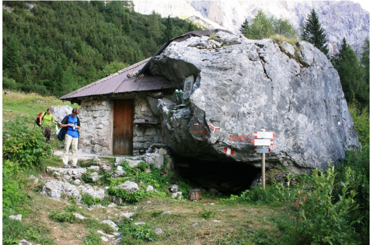
Finalmente, si avvista il baito dei Cacciatori, 1h45' ! ma il parcheggio dista ancora 50'!!! e una leggera risalita da mettere in conto... alla fine il disl. sarà di 900 mt!