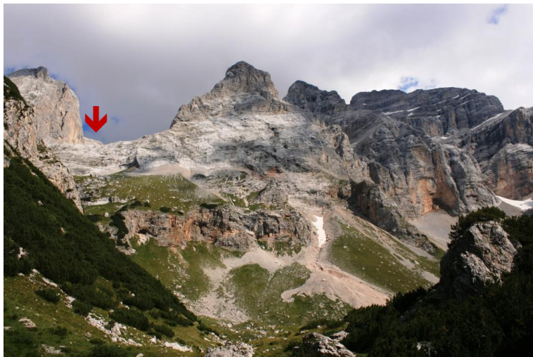
In pratica scesi da qui... (↓)