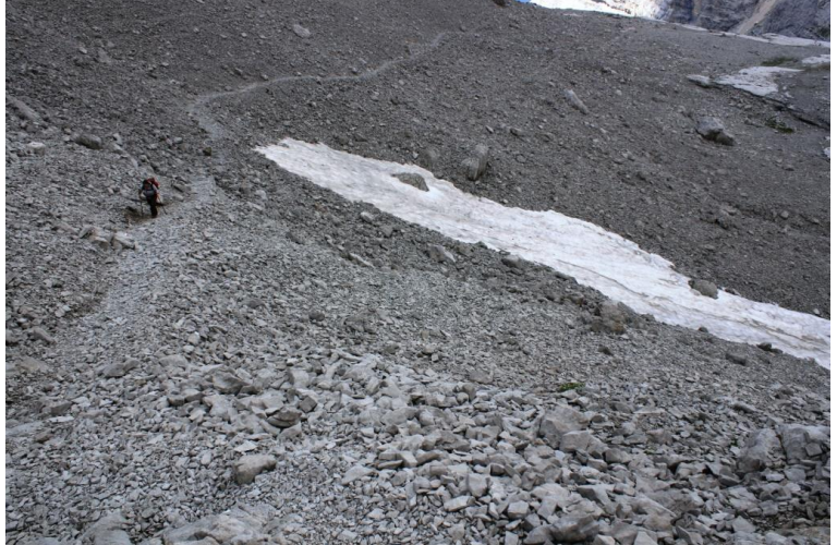
In un ambiente severo, si sale ancora al passo dei XII Apostoli, in 20', a 2620 mt.