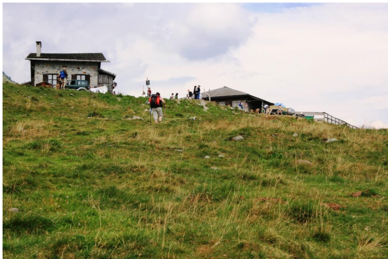
20' a malga Ritort, 1747 mt., molto affollato perché raggiunto da un trenino turistico Breve pausa pranzo e poi si riparte per sfuggire alla folla...