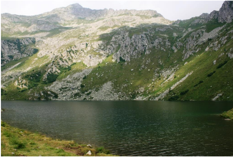
Il lago Ritort, raggiunto a piedi, dopo la salita con l'impianto '5 Laghi' 2055 mt 15'