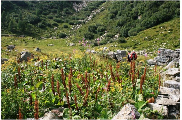
ruderi malga Pozza dei Garzoni 10'