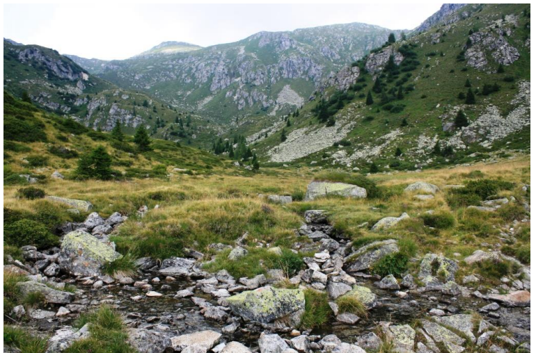
la vallata circondata da rupi che portano indietro nel tempo...