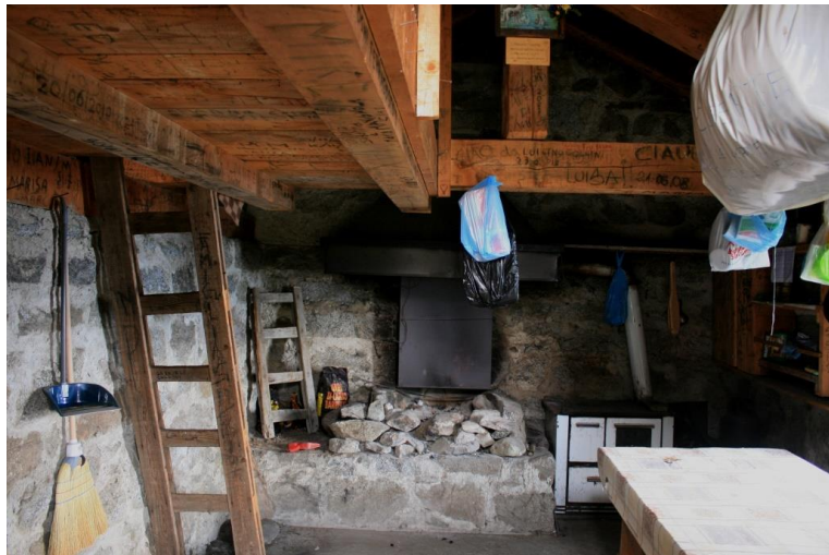
Il riparo è aperto e sommariamente arredato