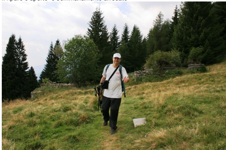
30' x i masi in rovina di Milegna 1637 mt Località, che prima di essere abbandonata, fu abitata dal XVI secolo