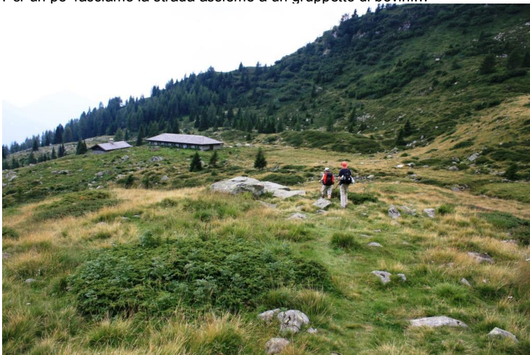
Arrivando a malga Valchestria... 1888 mt 1h