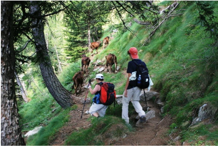
Per un po' facciamo la strada assieme a un gruppetto di bovini...