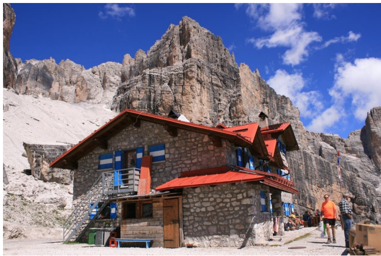
L'ambientazione del rifugio è notevole...