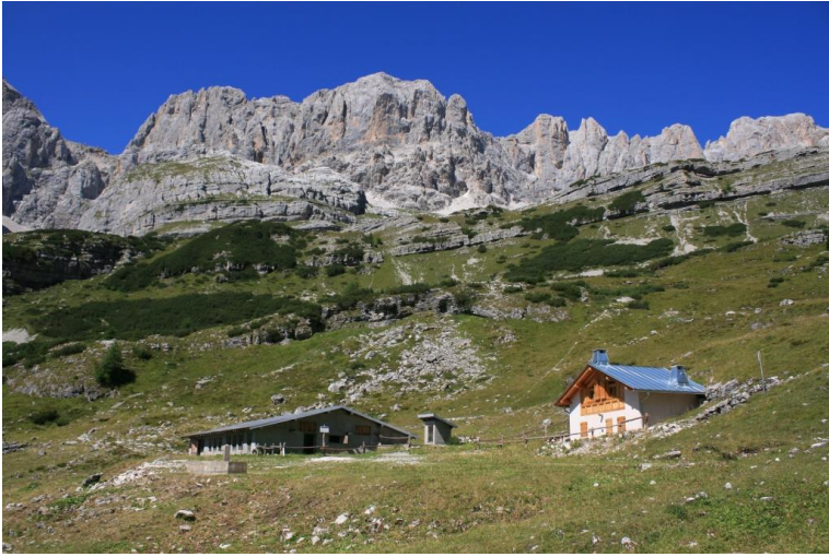
Malga Prato di Sopra