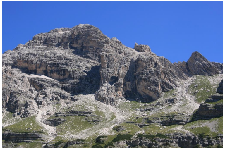
Panorama fantastico... dato che il cielo è molto terso (pioggia nella notte precedente...); il primo di tre giorni con meteo super...