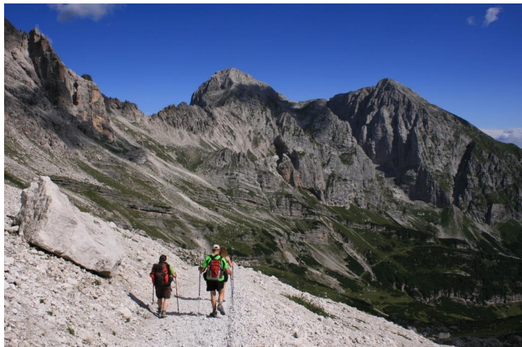
rientro in circa 1h15, camminando con calma e osservando bene intorno tutto quanto...