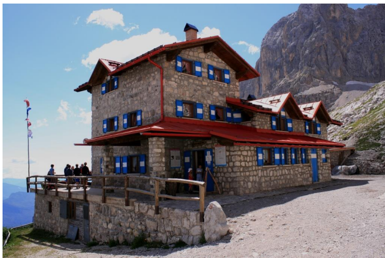
Finalmente, si arriva dal rif. Agostini (1h45, ma foto...) che spicca su un gradino roccioso, quasi in cima alla val d'Ambiez a 2410 mt