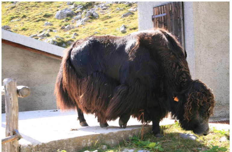
esemplare di Yak...!!!!!!!!!!!!!!