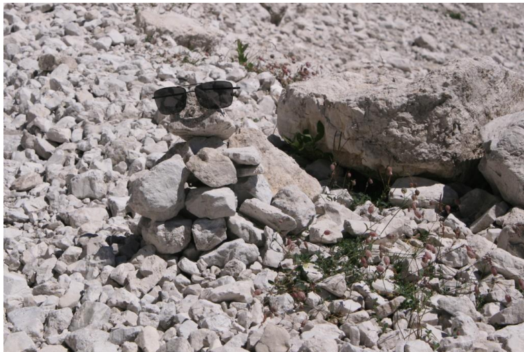
simpatico ometto di pietra costruito da Daniele...