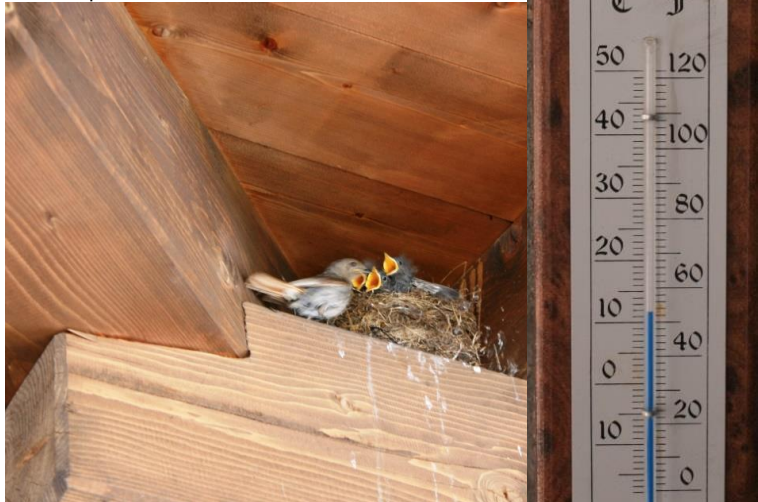
sopra la porta del rifugio... temperatura ideale x camminare