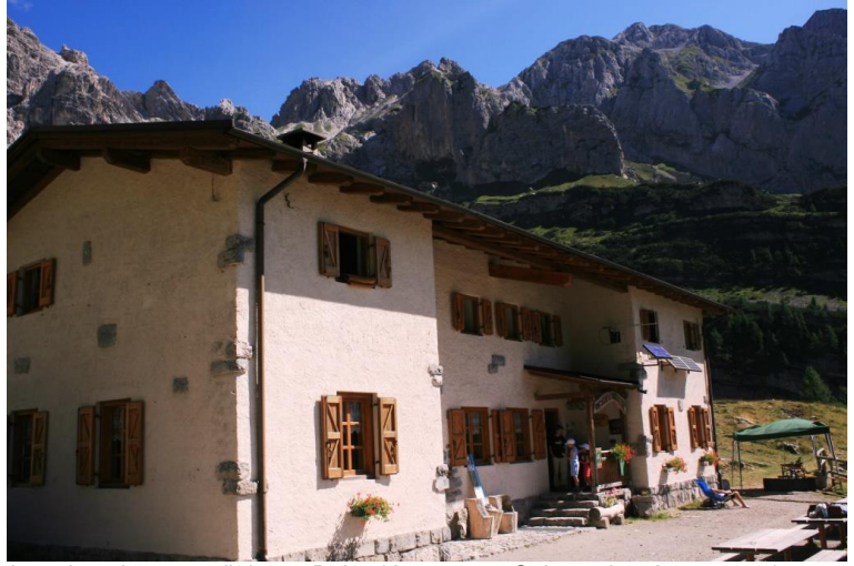
Da San Lorenzo in Banale si rimonta una stretta strada asfaltata fino ad arrivare al parcheggio presso il ristorante Dolomiti a 860 mt. Qui, grazie ad un puntuale e professionale servizio taxi jeep ( www.taximargonari.com 333 5909327), si saltano circa 950 mt di quota e in 30' si arriva dal rif. Cacciatori a 1821 mt