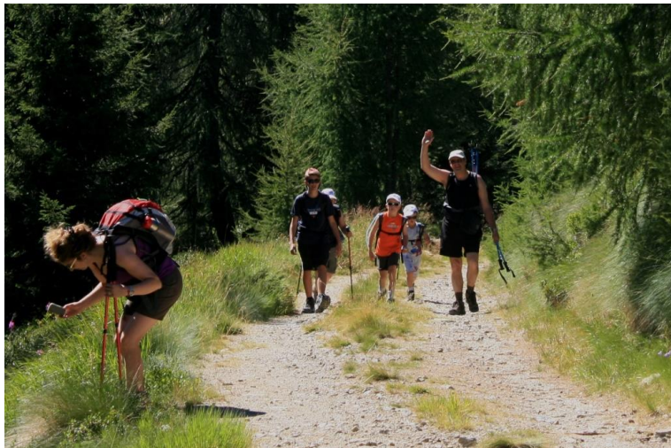
alla fine (15') la larga mulattiera confluisce sul sentiero segnato che si segue a dx (discesa)