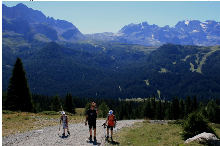
Si continua e quando la sterrata piega a sinistra verso Pradalago si tiene la destra e poi ancora la destra in modo deciso 1h15 dalla partenza