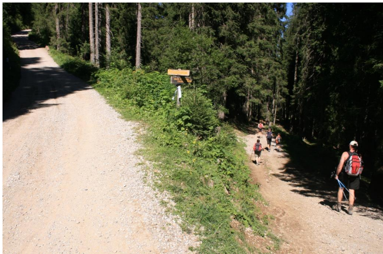
Dalla malga, inizialmente si segue la pista verso il Rif. Albasini, ma dopo 15' si piega a destra x Folgarida, usando nella parte finale la pista da sci Ancora 75' per l'Hotel Derby (difficoltà bassa, 4h tot. quasi 400 mt disl.)