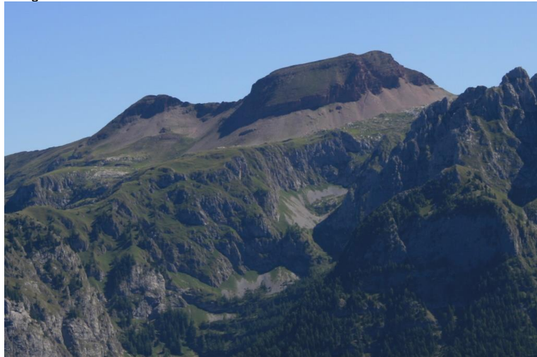
Il Sasso Rosso