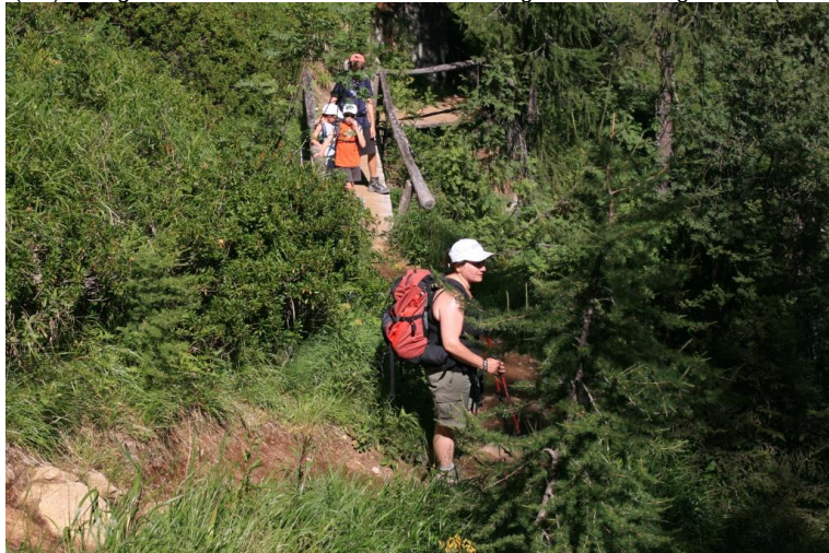
in modo abbastanza rapido si perde quota verso il lago