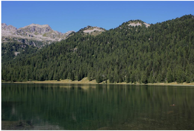
Il lago delle Malghette e l'omonimo rifugio (20') da dove si continua a calare verso la malga Dimaro per il pranzo all'aperto del mercoledì (40')