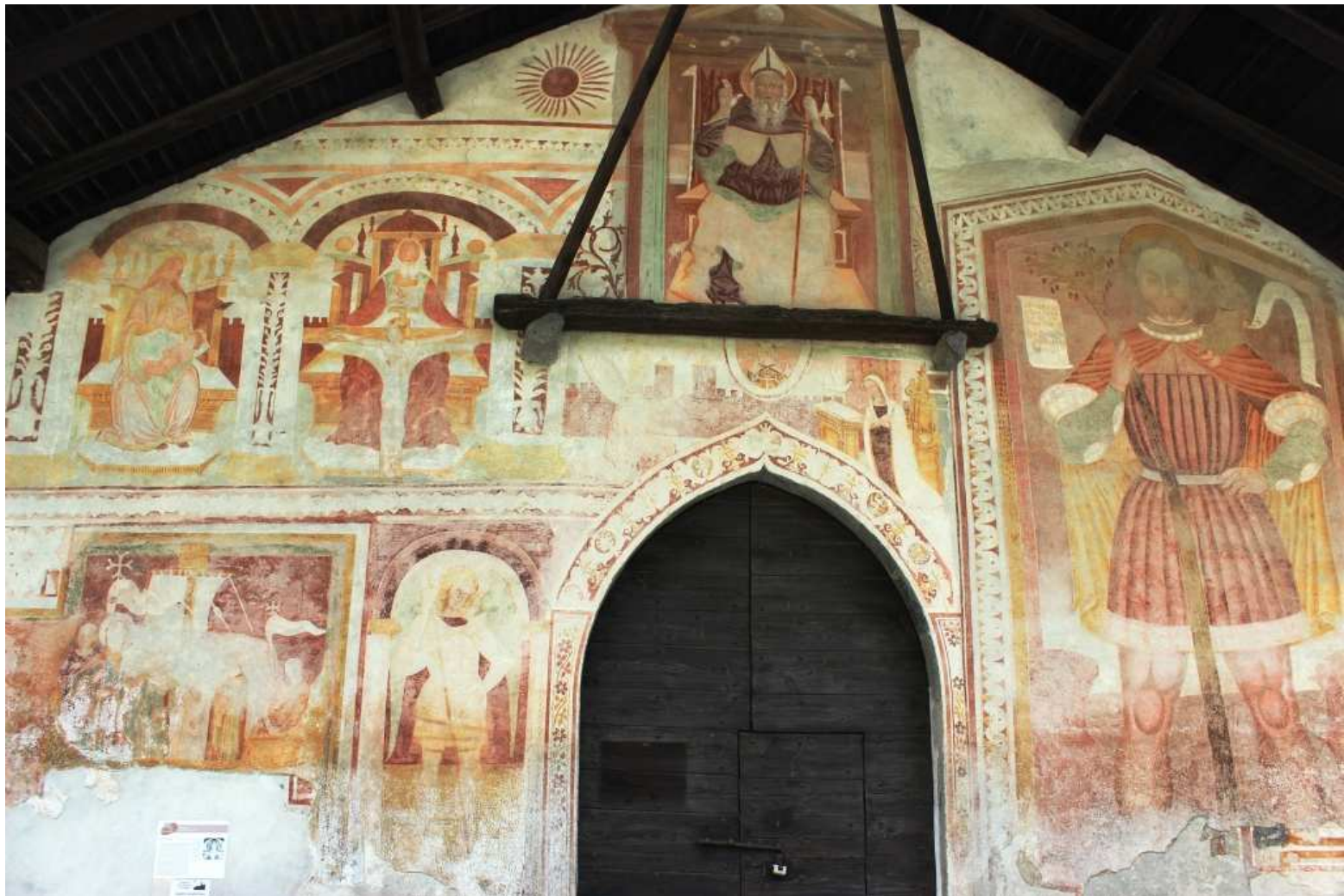
Facciata della chiesa di Sant'Antonio Abate a Pelugo (XV sec.) con un alto campanile e diversi interessanti affreschi