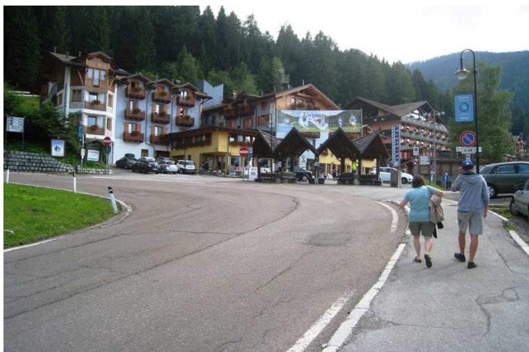
due passi verso il paesino di Folgarida