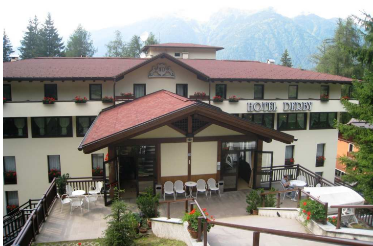
L'hotel Derby a Folgarida; ottima convenzione con il Cral al link http://cralgalliera.altervista.org/offerteturismo5.pdf zona parco bimbi e giochi vari