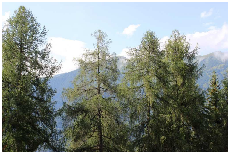
Panorama dalla finestra