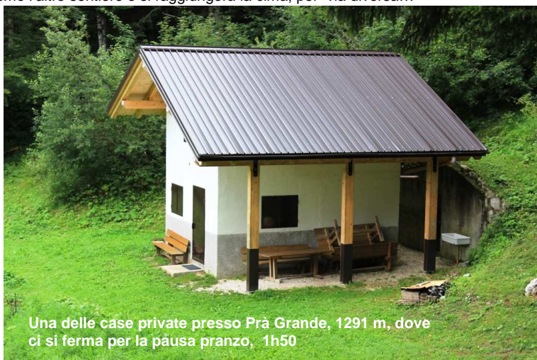
Una delle case private presso Prà Grande, 1291 m, dove ci si ferma per la pausa pranzo, 1h50