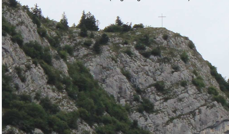
La Croce del Fai (ritaglio ingrandito della foto)