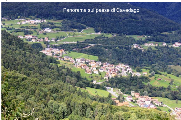
Panorama sul paese di Cavedago