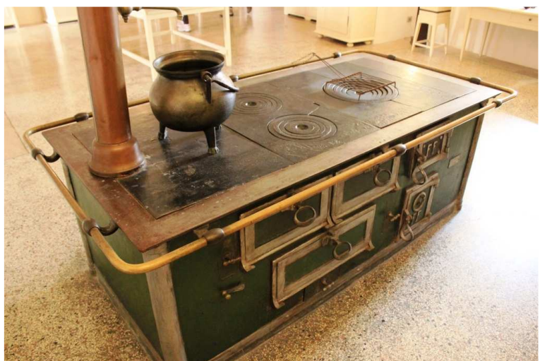
La cucina nuova è del primo Novecento, in uno spazio grande e pratico