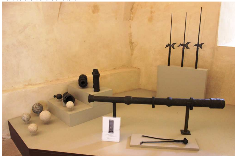
Sala delle armi: in rilievo la lunga "colubrina"