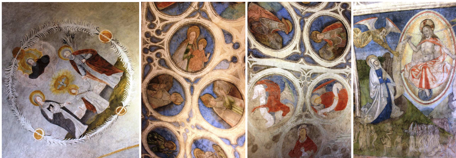
... conserva un interessante ciclo di affreschi di scuola tedesca risalenti al XV secolo, in un suggestivo ambiente gotico