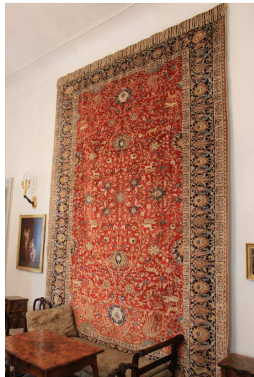
La visita prosegue in un susseguirsi di stanze elegantemente sistemate... in particolare si vedono: la Sala della Spinetta, delle Incisioni, dello Scrittoio (e...