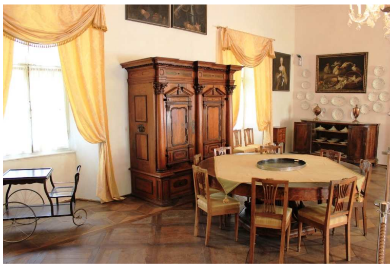
Sala da pranzo, con arredi, dipinti e stoviglie pregevoli...