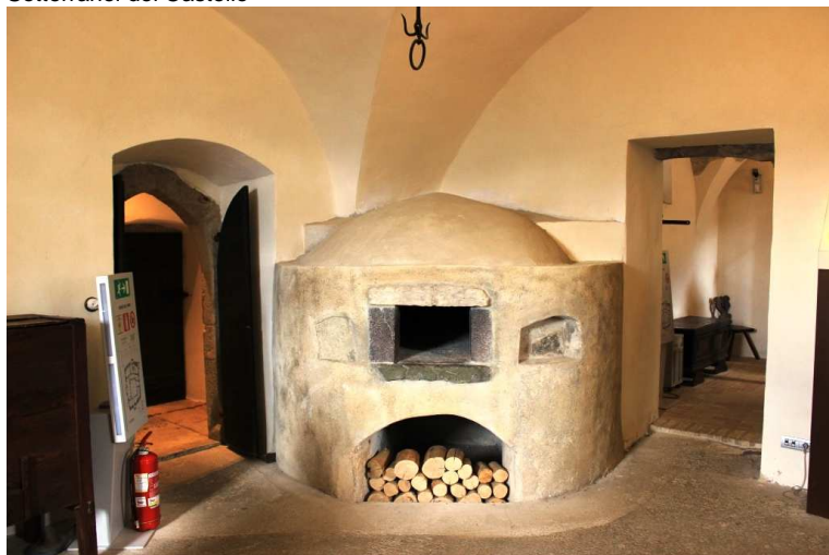
Il forno per cuocere il pane