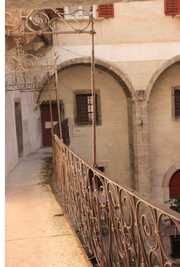
Fine prima parte, la seconda al link http://www.cralgalliera.altervista.org/Trentino014d2.pdf