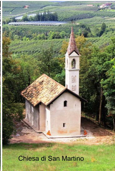
Chiesa di San Martino