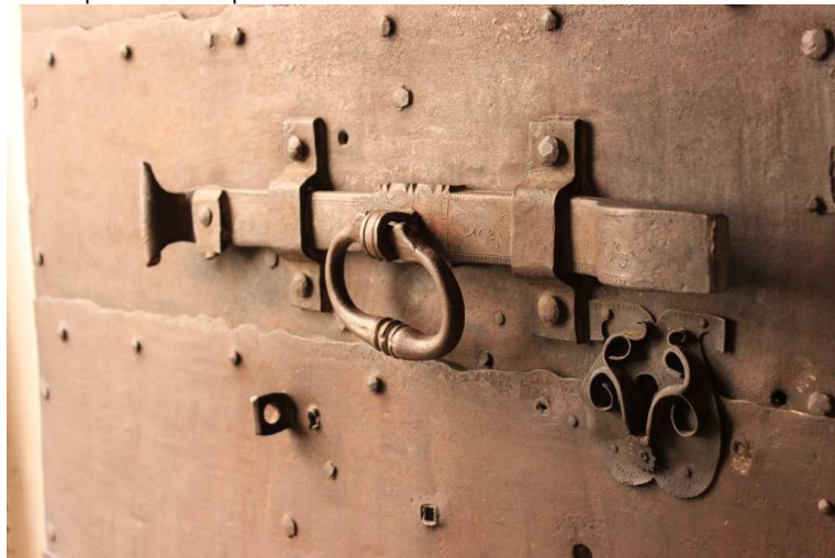
Particolare della serratura