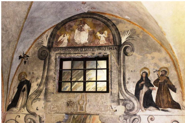
ingresso della cappella del castello, dedicata a S. Giorgio, al suo interno...