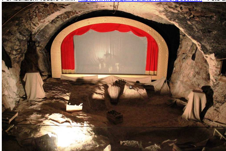
Sotterranei del Castello