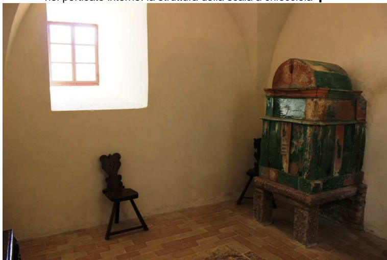
esempio del sistema di stufe che riscaldava le stanze (con caricamento esterno)