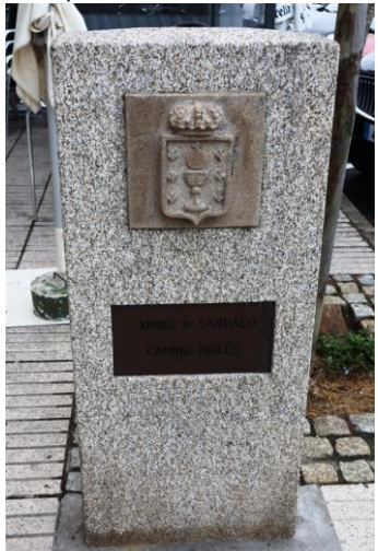
Il primo pilone