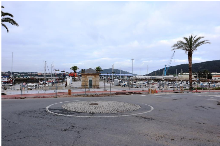
9.10 quando ha inizio il Camino da Ferrol