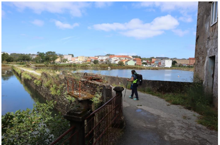
Prima di Xuvia (frazione del comune di Naron) si prende una variante più interessante, ma un po' più lunga +700 metri