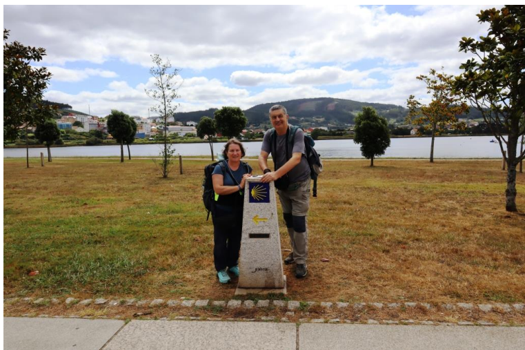
La pietra miliare che indica -100 km a Santiago