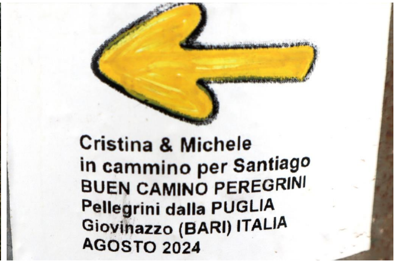
Adesivosu un palo di 2 italiani