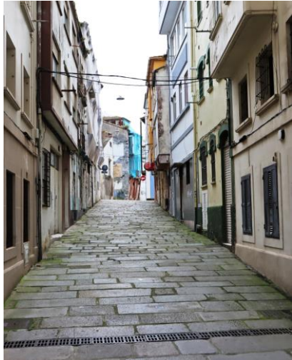
si attraversa la città