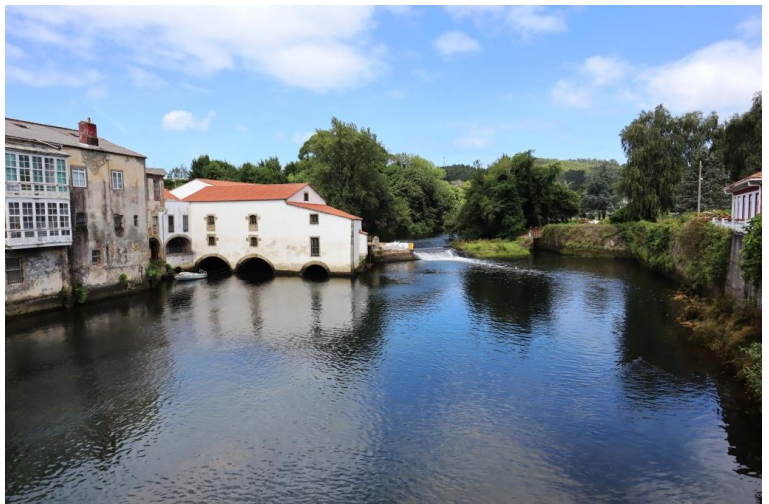
Si arriva quasi a Neda poi si torna indietro x mangiare e poi andare presso la stuttura doce si dormirà