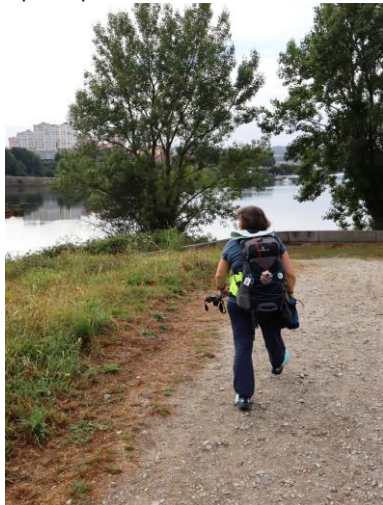
Si costeggia il mare