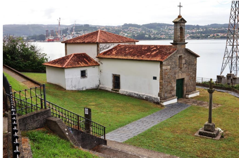
chiesetta lungo il percorso